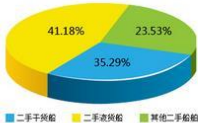
浙江市场二手船成交量对比